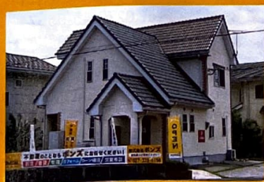
不動産の売買は、個人情報に関わるため、プライバシー厳守で相談に応じたい