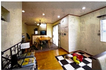
お子様連れのご家族でも、ゆっくり相談できるように キッズコーナーもある

ボンズは、そんな「売却困難不動産」の買取も行う会社です。 あなたの家は、あなたが気付いていない価値があります。